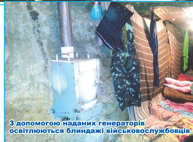
З допомогою наданих генераторів освітлюються блиндажі військовослужбовців