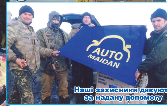
Наші захисники дякують за надану допомогу