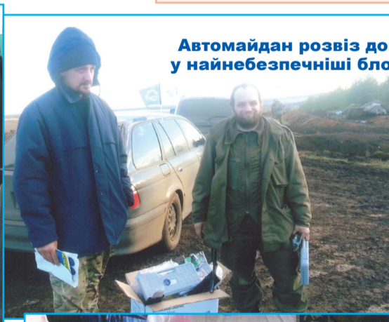
Автомайдан розвіз допомогу у найнебезпечніші блок-пости