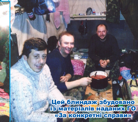
Цей блиндаж збудовано із матеріалів наданих ГО «За конкретні справи»