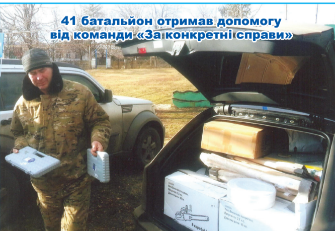
41 батальйон отримав допомогу від команди «За конкретні справи»