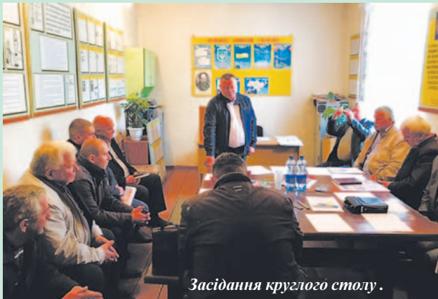
Засідання круглого столу.

Проблема росту комунальних тарифів сьогодні є дуже болючою для населення, особливо для жителів сіл, які мають менші зарплати та не завжди можуть дозволити собі оплачувати великі суми.