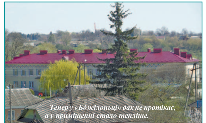
Тепер у «Бджілоньці» дах не протікає, а у приміщенні стало тепліше.

Діяльність команди «За конкретні справи» тільки посилюється після виборів. Результати люди можуть побачити на власні очі. «Бджілонька» не єдиний приклад ро-