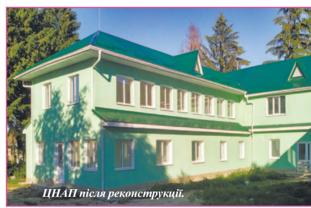
ЦНАП після реконструкції.

Страшний випадок стався з місцевою жителькою, яка через заметені дороги та хуртовини не змогла вчасно дістатися до районної центральної лікарні, її привезли до Ямп