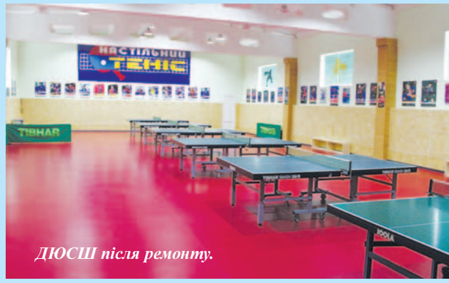
ДЮСШ після ремонту.

На сьогодні заплановані роботи успішно завершили. Учні Красилова та району отримали сучасний спортивний комплекс.